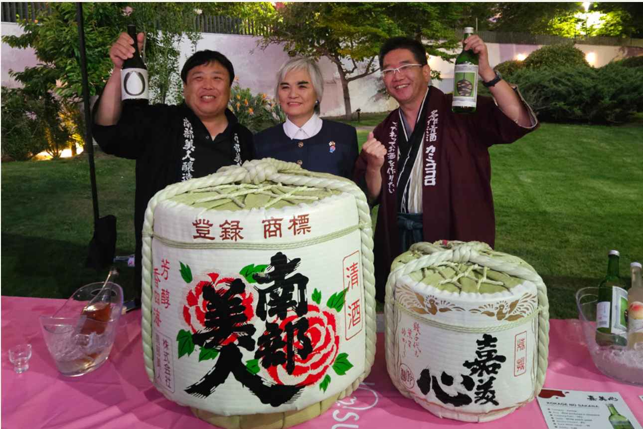
Asamblea General noviembre 2024