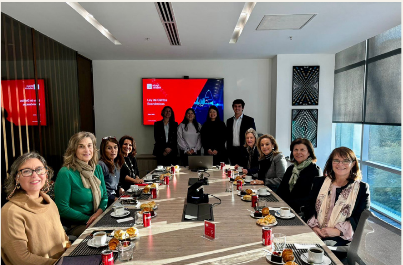
“Luces rojas, amarillas y verdes” sobre ley de delitos económicos