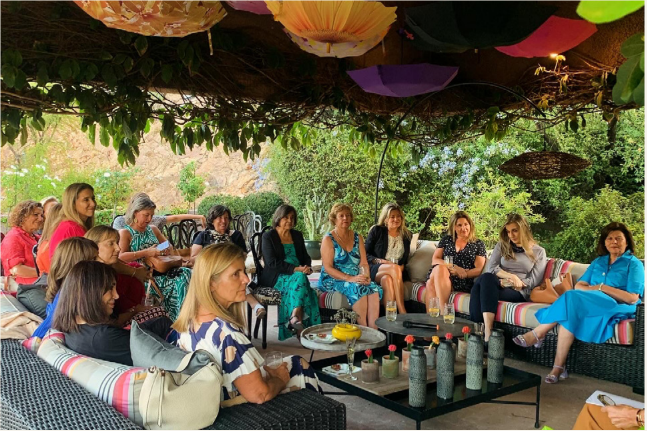
Bienvenida nuevas socias