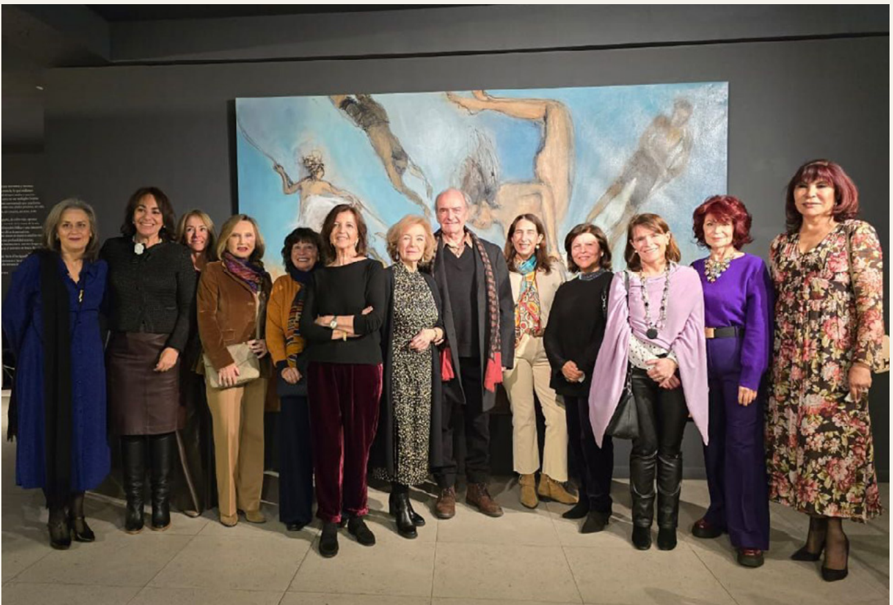
Dine Around — Noche de arte en Galería Artespacio