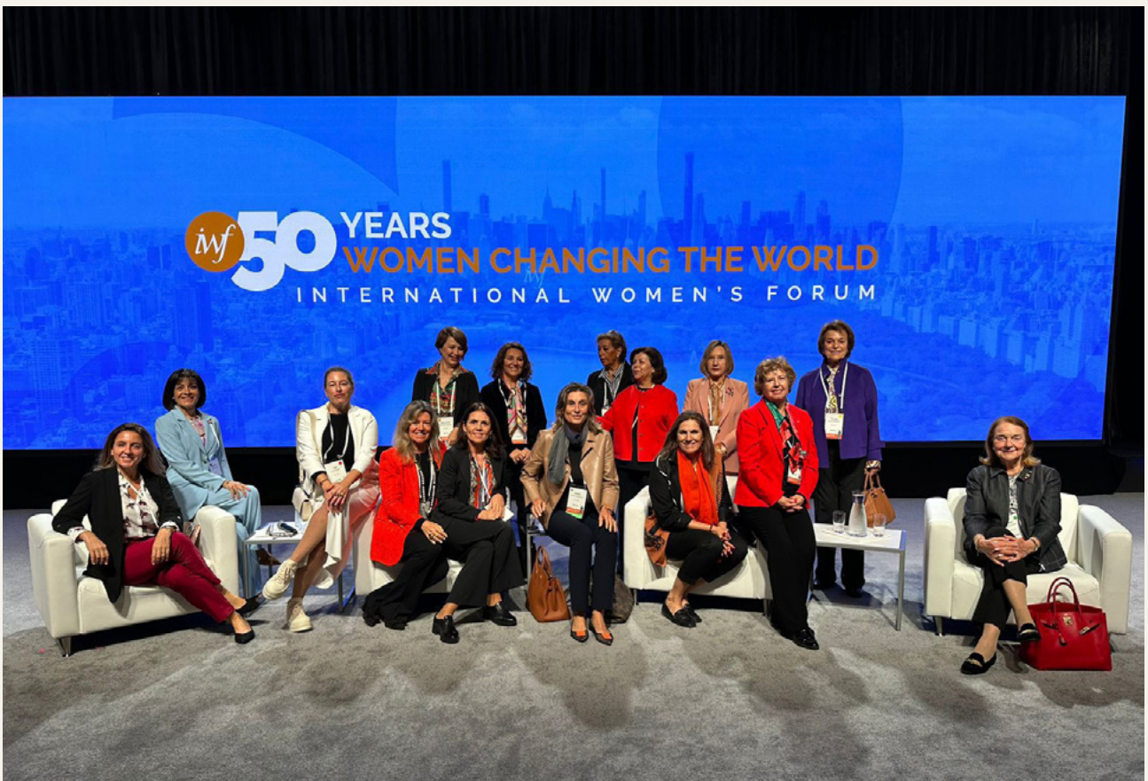
Celebración 50 años IWF Global, Conferencia Nueva York, mayo 2024