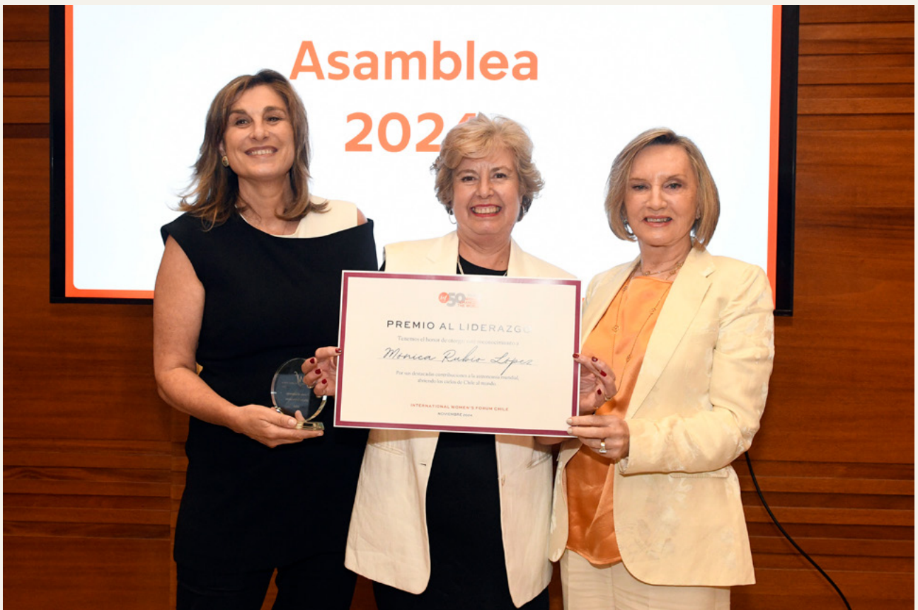
Asamblea General noviembre 2024