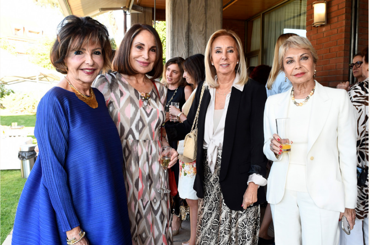
Asamblea General noviembre 2024