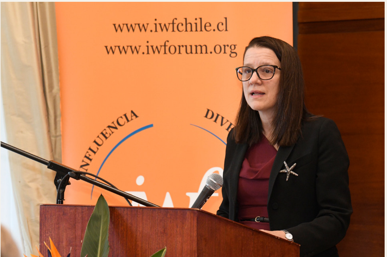
Asamblea General noviembre 2024