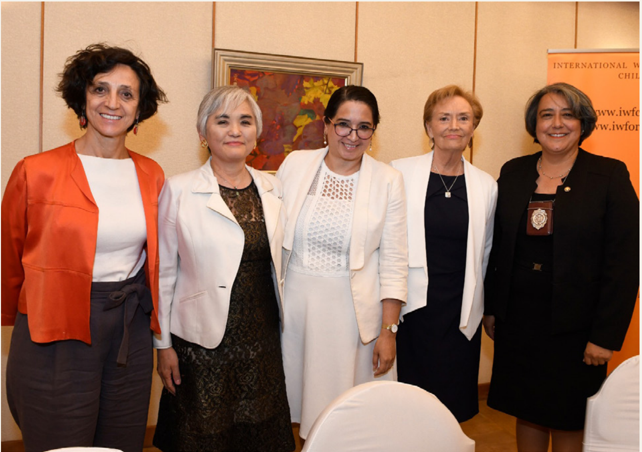
Conversatorio “El aporte de las mujeres a la paz y seguridad globales”