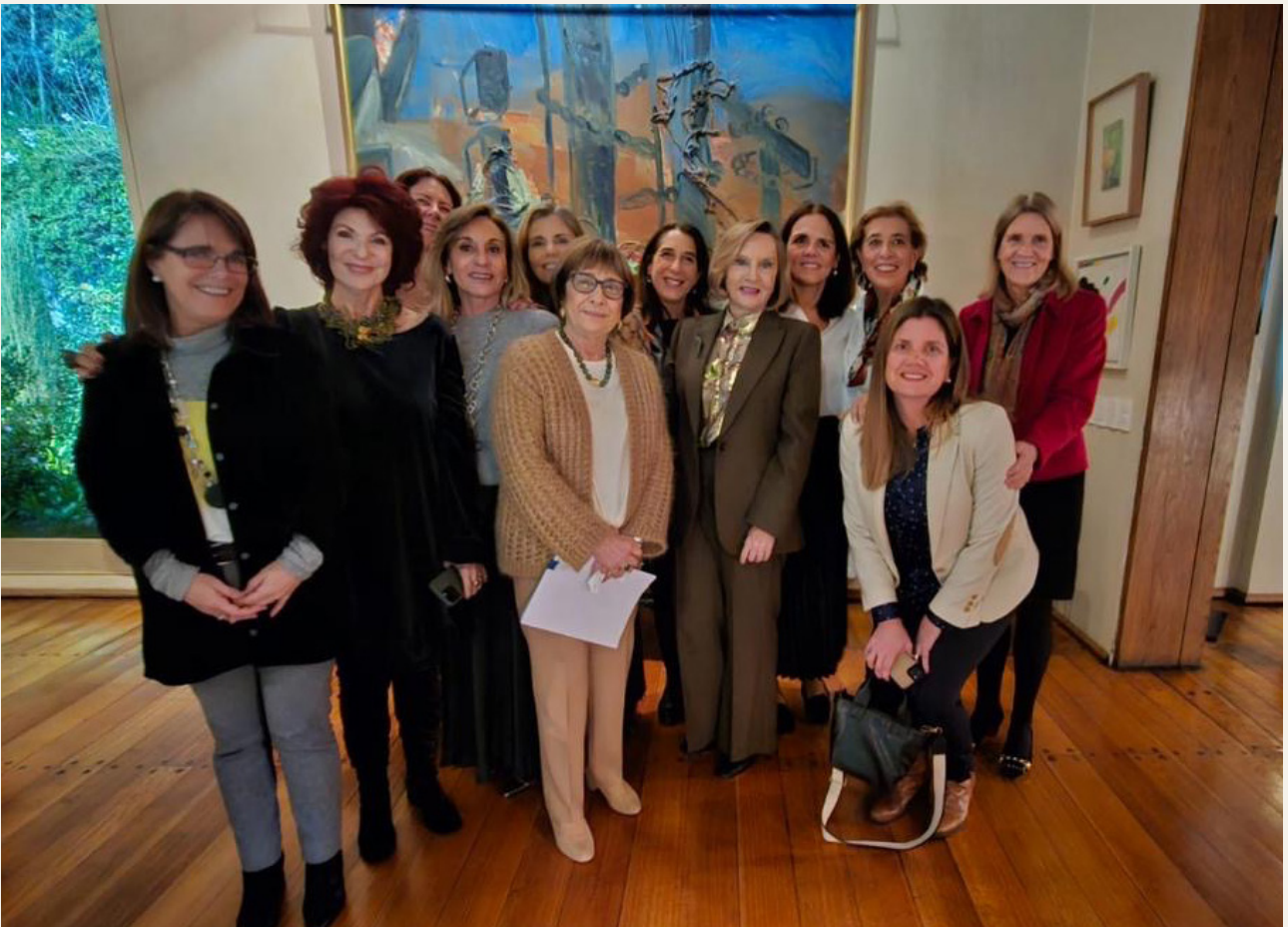
Dine Around — Mujeres mayores de 60, sanas y con ganas. No al Edadismo.