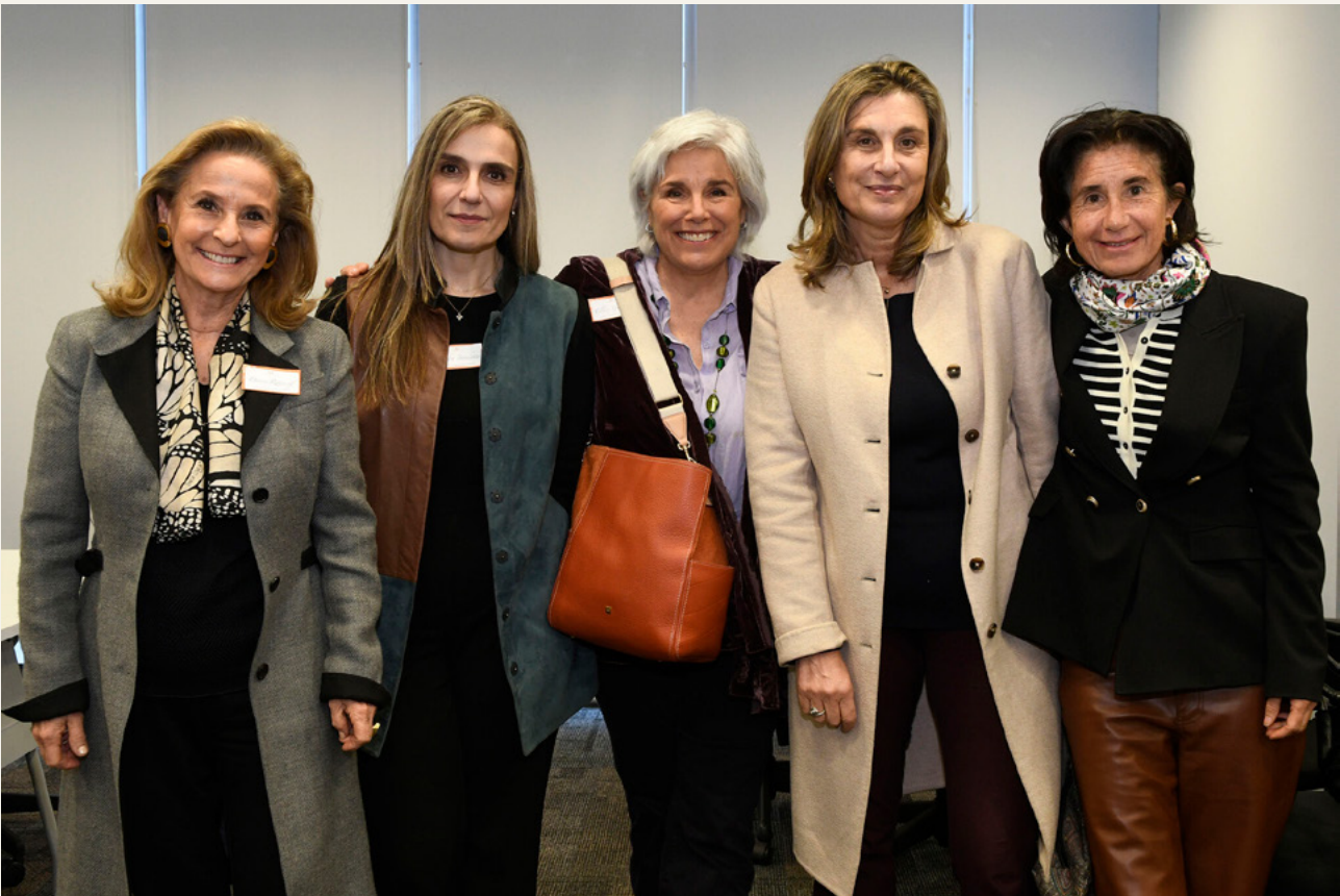
Planificación Estratégica 2024