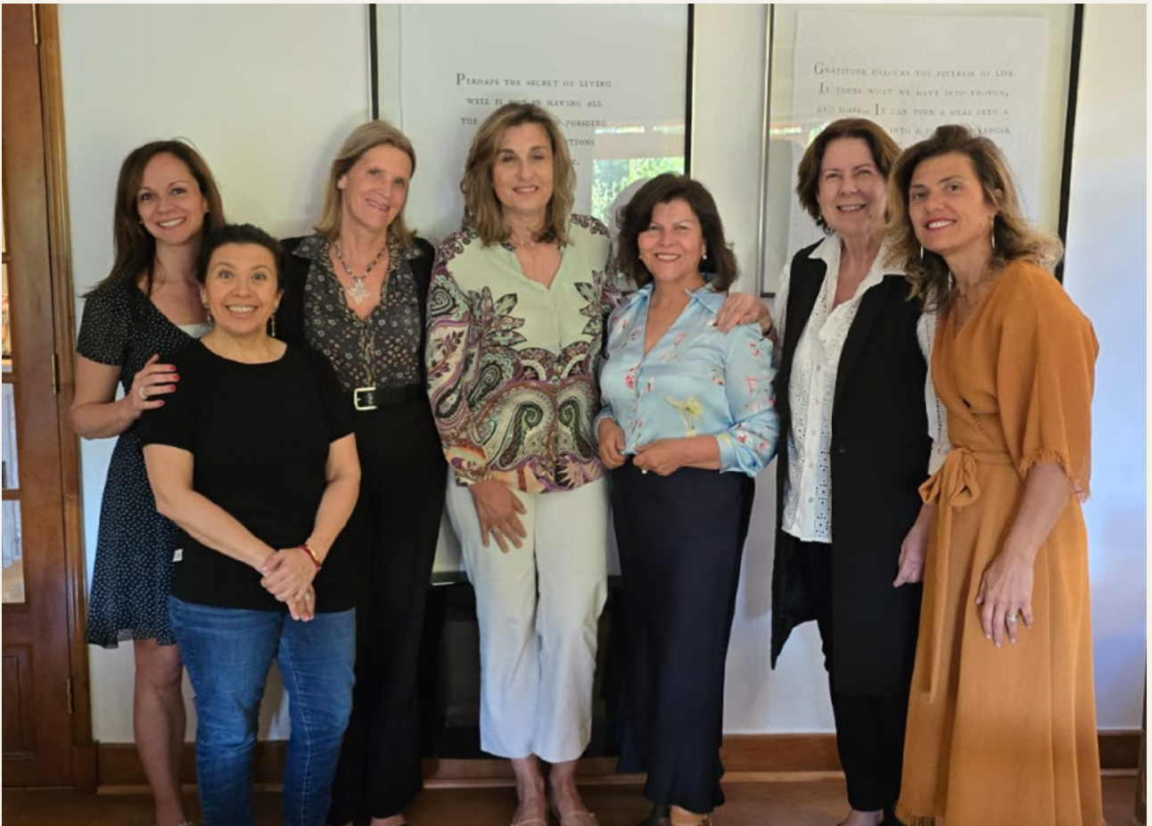
Dine around – El rol de la mujer en la filantropía