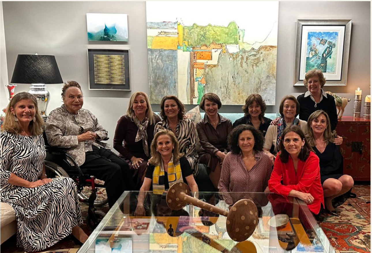
Dine Around — Desafíos éticos del uso de la IA en la medicina