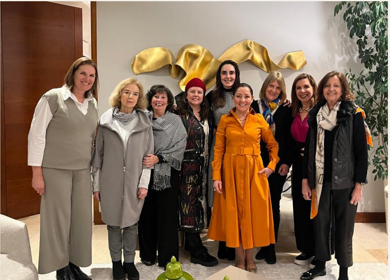
Dine Around — Alcances de la medicina antiedad y metabólica