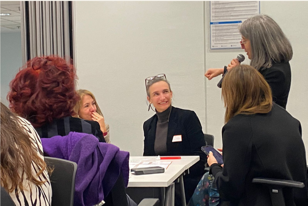
Planificación Estratégica 2024